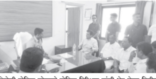
शिरोली पोलिस स्टेशनचे पोलिस निरीक्षक यांची भेट घेऊन किरीट सोमय्या यांनी चर्चा केली.