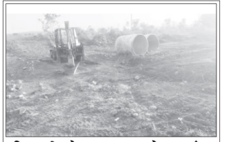
शिरगुणी ओढ्याच्या स्वच्छतेला प्रारंभ निपाणी, ता. ३१ (प्रतिनिधी) -