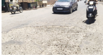
सांगली रोडवरील यझाव फाटा परिसरात दररोज अपघातांची मालिका सुरू आहे. तसेच वाहतूक व्यवस्थानासाठी योग्य उपाययोजना कराव्यात, अशी मागणी नागरिकांकडून जरा परत आहे. अस्थायी एखादा मोठा अपघात होण्याची भीती व्यक्त केली जात आहे.

लाहान-मोठी वाहने प्रवास करत असतात. विशेषतः अवेजड वाहनांच्या वाहतुकीमुळे रस्त्याची दुर्लक्ष अतिकच वाढली आहे. ठिकठिकाणी पडलेले मोठे खडे वाहनचालकांसाठी धोकादायक ठरत असून, रात्रीच्या वेळी हे खडे न दिसल्यामुळे अपघातांचे प्रमाण वाढले आहे. याशिवाय, सतत होणाऱ्या वाहतुकीमुळे या ठिकाणी वारंवार ट्रॅफिक जामची समस्या निर्माण होत आहे. अचानक वाहनांची गर्दी वाढल्याने वाहनचालकांना मोठा मनस्ताप सहन करावा लागत आहे. अनेक वेळा आपत्कालीन सेवानाही