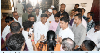
श्री शंभुतीर्थ स्मारक कामाच्या विलावावत महानगरपालिकाच्या पदाधिकार्यांवर प्रस्ताव भाडिमार करताना हिंदूत्ववादी कार्यकर्ते