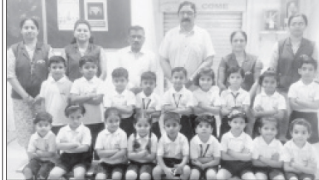
ऑलिम्पियाड स्पर्धेत यश मिळविलेल्या साई स्कूलच्या विद्यार्थ्यांसमवेत मानदंडी शिक्षक, शिक्षिका

यावेळी बोलताना त्यांनी नमूद केले की, 'टोप गावातील वारकरी संप्रदाय दरवर्षी अतस्त शिवस्तवद पद्धतीने पारंपारिक सोहळा आयोजित करतो. हा सोहळा म्हणजे गावाची आध्यात्मिक ओळख आहे. ही परंपरा अशीच अविनाश्य राहू देवावी, त्यासाठी आमचे नेहमीच सहकार्य लाभेल.' या कार्यक्रमाला गावातील वारकरी मंडळी, भजनी मंडळाच्या महिला आणि ग्रामस्थ मोठ्या संख्येने उपस्थित होते.