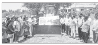
श्रुचीरांचे गाव म्हणून ओळखल्या जाणाऱ्या सैनिक टाकळी (ता. शिराळा) येथे आता पर्वावरणाचे रक्षण आणि जनसंरक्षणचे एक नवे पर्व सुरू झाले आहे. 'सत्संग फाऊंडेशन' च्या वतीने गाव तलावच्या संदर्भाने कामाचा नुकताच शुभारंभ करण्यात आला.

सै.टाकळी, ता. ८ (प्रतिनिधी) श्रुचीरांचे गाव म्हणून ओळखल्या जाणाऱ्या सैनिक टाकळी (ता. शिराळा) येथे आता पर्वावरणाचे रक्षण आणि जनसंरक्षणचे एक नवे पर्व सुरू झाले आहे. 'सत्संग फाऊंडेशन' च्या वतीने गाव तलावच्या संदर्भाने कामाचा नुकताच शुभारंभ करण्यात आला.