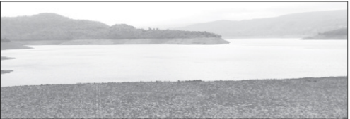
चांदोली धरणात सध्या समाधानकारक पाणीसाठा शिल्लक आहे.

जंगलातील रातडी प्राणीही पाण्याच्या शोधात मानवी वस्तीकडे वळू लागले आहेत. विबडे, रानडू वकर या सांखड्या प्राण्यांची हालचाल वाढली असून, त्यामुळे गावांमध्ये भीतीचे वातावरण निर्माण झाले आहे. काही ठिकाणी पाळीव जनावरांवर हल्ल्यांचा घटनाही घडत आहेत. पाण्याच्या एका प्रश्नाने मानव आणि